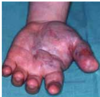
Pred zdravljenjem s ScleroGel®-om