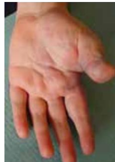
Po zdravljenju s ScleroGel®-om