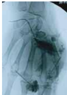
Gel + kontrastno sredstvo